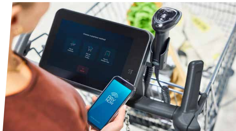
03_ICI, LE CLIENT S'ENCAISSE LUI-MÊME