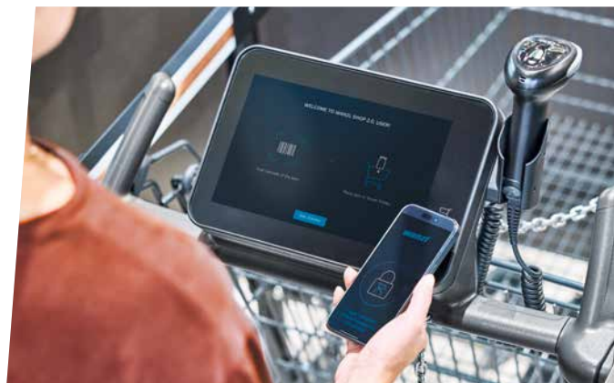
01_CONNEXION SIMPLE ET RAPIDE !

Autre avantage : il a toutes les cartes en main pour consolider et élargir sa relation avec sa clientèle au-delà du magasin à proprement parler. Ainsi, le passage du client dans le magasin peut devenir un parcours client complet et renforcer considérablement la fidélisation des clients, par exemple par la mise à disposition de coupons, de promotions ou l'intégration d'offres multicanales.