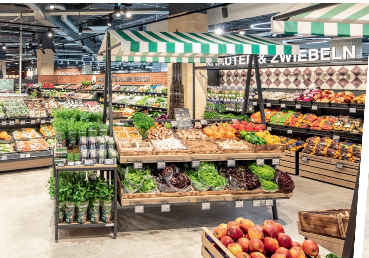
↑ Farmer's Friend, un étal de marché hebdomadaire disponible tous les jours : avec des produits en vrac présentés de façon appétissante, recouverts par un store classique en toile rayée.

■ Une production durable et naturelle est aujourd'hui un critère de décision d'achat très important pour de nombreux consommateurs. Dans l'idéal, les fruits et légumes devraient être produits localement, fraîchement récoltés et passer directement de l'étal du marché à l'assiette du consommateur. Les marchés hebdomadaires connaissent un boom continu. C'est pourquoi l'équipe de Wanzl Shop Solutions a conçu la table Farmer's Friend, qui confère à chaque magasin une ambiance de marché. Garnie de produits principalement régionaux qui sont disposés en vrac dans des caisses en bois rustiques, la nouvelle table de vente de la gamme d'aménagement de magasins proposée par Wanzl incite à l'achat tout comme les bons vieux étals d'un marché : des produits à la fraîcheur palpable et que l'on peut emmener chez soi !