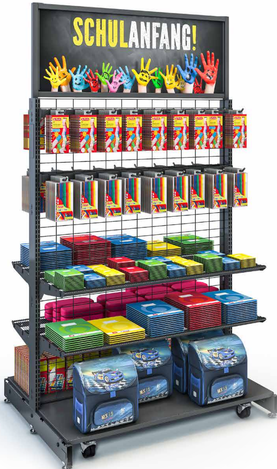
WIRE TECH 100 MOBILE lässt sich durch belastbare Lenkrollen flexibel positionieren