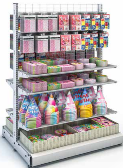
WIRE TECH 100 MOBILE mit Drahtetagen und Blisterhaken

■ Mit dem fahrbaren Präsentationssystem wire tech 100 mobile setzen Sie Themenwelten und Saisonartikel immer wieder spannend in Szene. Der Werberahmen nimmt großflächige Plakate auf, fördert die Wahrnehmung und aktiviert die Kunden. Die Wanzl-Drahtetagen lenken den Blick der Kunden auf das Wesentliche: Ihre angebotenen Produkte.