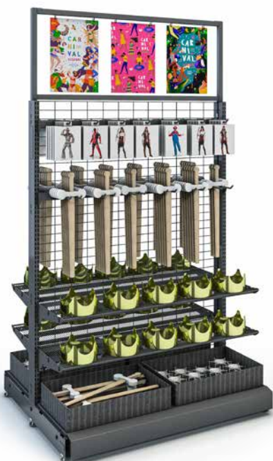
WIRE TECH 100 MOBILE mit Drahtetagen, Blisterhaken und Werberahmen mit Tafeln