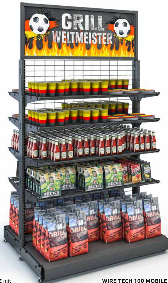
WIRE TECH 100 MOBILE mit Drahtetagen und Werberahmen