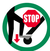
Frenar Ben's Cart

Detener el Ben's Cart junto al vehículo del cliente con el freno de pie de la rueda trasera. Abrir el cinturón de seguridad del carro de autoservicio y sentar al niño en el carro. Abrochar el cinturón de seguridad. Soltar el freno de parada de la rueda trasera y ¡en marcha!