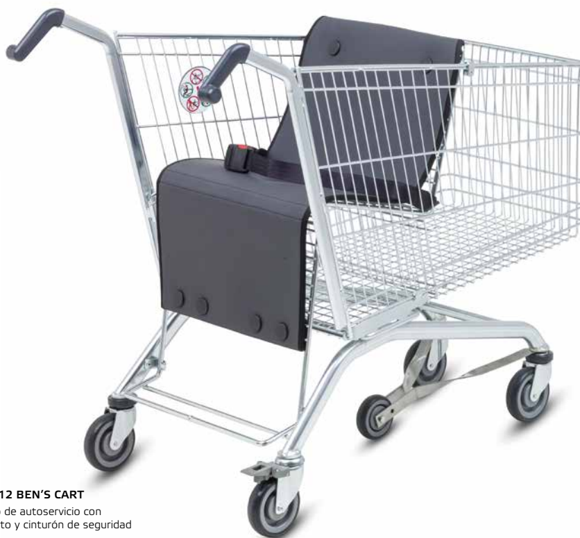
EL 212 BEN'S CART Carro de autoservicio con asiento y cinturón de seguridad