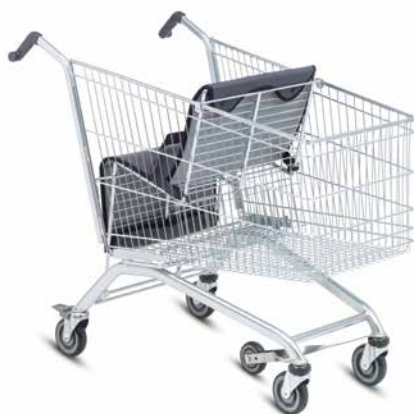
EL 212 BEN'S CART