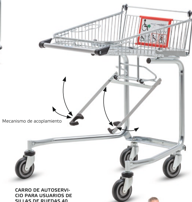
CARRO DE AUTOSERVICIO PARA USUARIOS DE SILLAS DE RUEDAS 40 con mecanismo de acoplamiento de serie