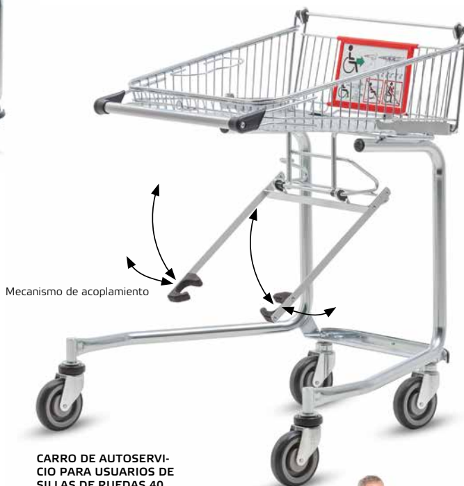
CARRO DE AUTOSERVICIO PARA USUARIOS DE SILLAS DE RUEDAS 40 con mecanismo de acoplamiento de serie