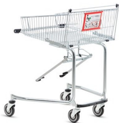
CARRO DE AUTOSERVICIO PARA USUARIOS DE SILLAS DE RUEDAS 90 con mecanismo de acoplamiento de serie