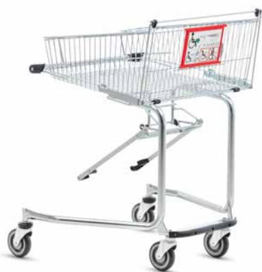
CARRO DE AUTOSERVICIO PARA USUARIOS DE SILLAS DE RUEDAS 90 con mecanismo de acoplamiento de serie