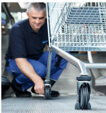
WANZL BEUGT PROBLEMEN VOR , beseitigt Mängel und hält den reibungslosen Betrieb am Laufen.