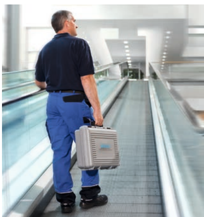
WANZL BERÄT SIE GERNE VOR ORT , um die Umgebungssituation bei der Auswahl des für Sie geeigneten Systems zu berücksichtigen.