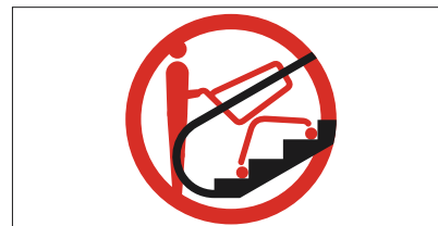
Einkaufswagen nicht auf Rolltreppe Best.-Nr. 01.88 076.07