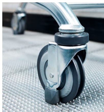
I RICAMBI ORIGINALI Wanzl garantiscono massima sicurezza, funzionamento ottimale e lunga durata.