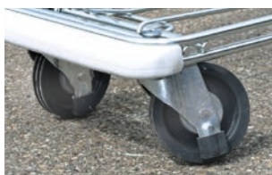
Fissaggio ruote danneggiato

Possibili errori e difetti, che causano problemi nell'utilizzo su tappeto mobile, compromettendo la sicurezza.