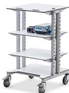
Poste de travail mobile avec tablette supplémentaire