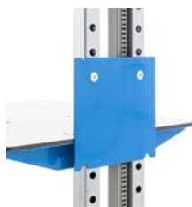
Support-batterie latéral pour bureau mobile à hauteur fixe

La batterie peut être fixée sur le côté du bureau mobile , ainsi que sur la tablette centrale. Elle peut être accrochée sans autre accessoire sur le montant latéral du bureau mobile à hauteur variable. Pour toutes les autres variantes, il est nécessaire de visser un support-batterie (accessoire) sur lequel la batterie peut être suspendue.