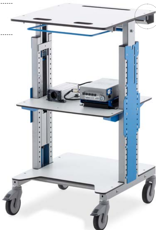
POSTE DE TRAVAIL MOBILE avec plateau à hauteur variable

Illustration avec alimentation électrique mobile (option)