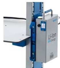
La batterie peut être fixée sur la tôle latérale du bureau mobile à hauteur variable sans aucun autre accessoire.