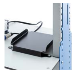
Support-batterie à fixer sur la tablette centrale