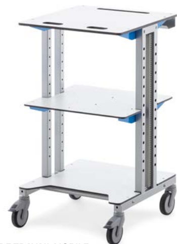
POSTE DE TRAVAIL MOBILE Version à hauteur fixe

Le câblage des appareils raccordés est souvent encombrant. Là il disparaît dans la partie arrière du plateau de table.