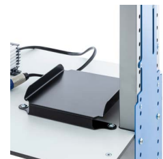
Adapterplatte für Akku-Anbringung auf der Mitteletage.