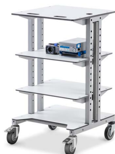
Mobiler Arbeitsplatz mit zusätzlicher Etage