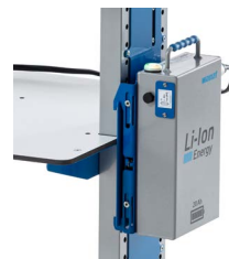
Der Akku kann ohne weiteres Zubehör am Seitenblech des höhenverstellbaren Tischwagens eingehängt werden.