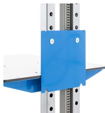
Adapterplatte für seitliche Akku-Anbringung an starrer Ausführung.

Der Akku kann sowohl seitlich am Tischwagen als auch auf der Mitteletage befestigt werden. Die Anbringung an der Seite des höhenverstellbaren Tischwagens ist ohne weiteres möglich. Bei allen anderen Varianten erfolgt die Anbringung mittels einer nachträglich angeschraubten Adapterplatte (Zubehör), in die der Akku eingehängt werden kann.