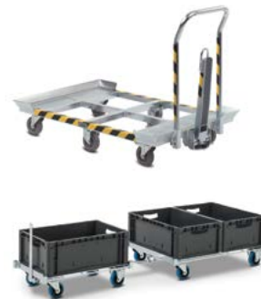
Für Paletten und Boxen im Routenzug