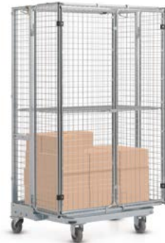
In zahlreichen Ausführungen

Vom Multi-Channel-Versender bis hin zum großen Internet-Pure-Player: wir fertigen unsere Produkte abgestimmt auf das jeweilige Logistik-Konzept. Und wenn's mal etwas mehr sein soll, dann liefern wir auch große Stückzahlen in kurzer Zeit.