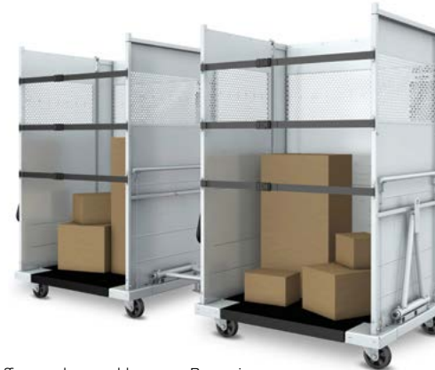
In offener oder geschlossener Bauweise