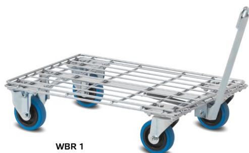
WBR 1 600 x 400 mm