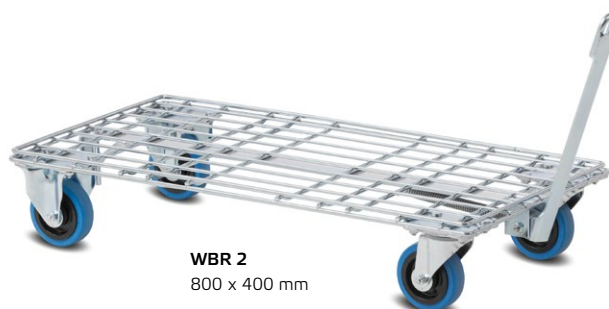
WBR 2 800 x 400 mm