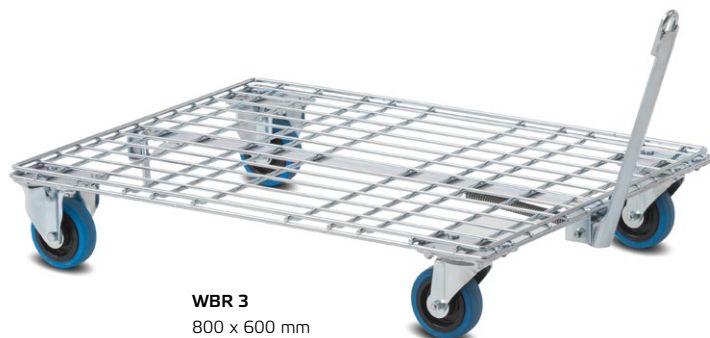
WBR 3 800 x 600 mm

Équipement de série : plateau en grille fil. Timon d'attelage pour le couplage de plusieurs plateaux roulants.