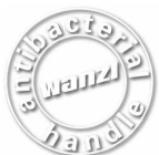
VOYAGER EVOLUTION 3000 Carros de equipaje