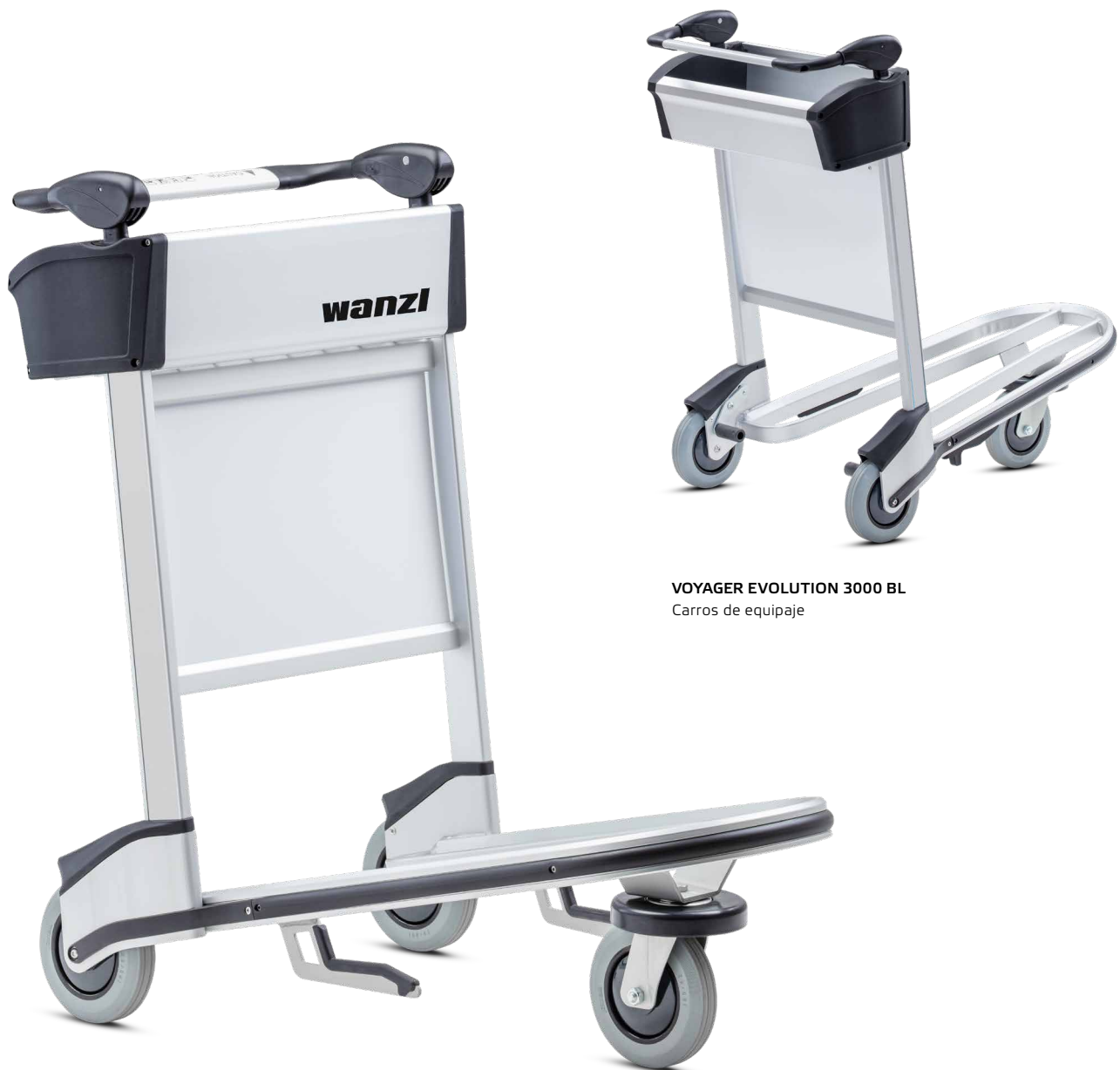
VOYAGER EVOLUTION 3000 BL Carros de equipaje