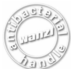
VOYAGER EVOLUTION 3000 Chariot à bagages