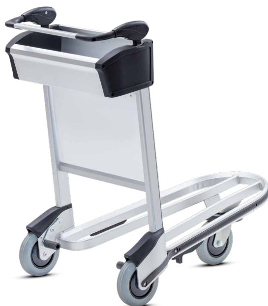
VOYAGER EVOLUTION 3000 BL Chariot à bagages