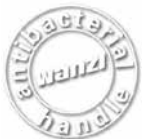
VOYAGER EVOLUTION 3000 行李运输手推车