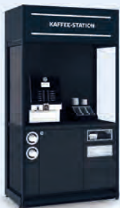
ESTACIÓN DE CAFÉ 1250 × 600 × 2400 sin cafetera N.º de referencia 37.59778.95-0001