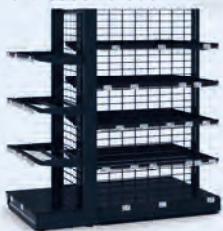
GÓNDOLA DE VENTA + CABECERA DE GÓNDOLA 1000 × 400 × 1600 con 4 estantes de varilla N.º de referencia 04.16380.95-7097