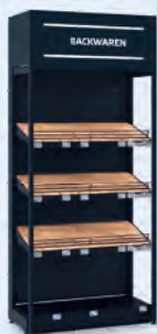
EXPOSITOR DE PRODUCTOS DE PANADERÍA 1000 × 400 × 2400 con 3 estantes de madera N.º de referencia 04.16386.95-0001