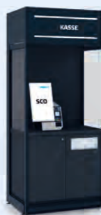
MÓDULO SCO WIRE TECH 100 1000 × 600 × 2400, con superestructura N.º de referencia 37.59779.95-0001 Terminal de caja SCO N.º de referencia 98.78957.00-0000