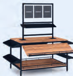
YOURTABLE T.01 con panel publicitario para módulo 1265 × 865 × 750 N.º de referencia 04.16381.95-7097