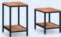
YOURTABLE T.02 665 × 465 × 550 N.º de referencia 04.16382.95-7097 665 × 465 × 750 N.º de referencia 04.16383.95-7097