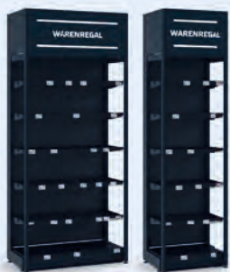
ESTANTERÍA con 5 estantes de varilla con superestructura 1000 × 400 × 2400 N.º de referencia 04.16389.95-0001 625 × 400 × 2400 N.º de referencia 04.16388.95-0001