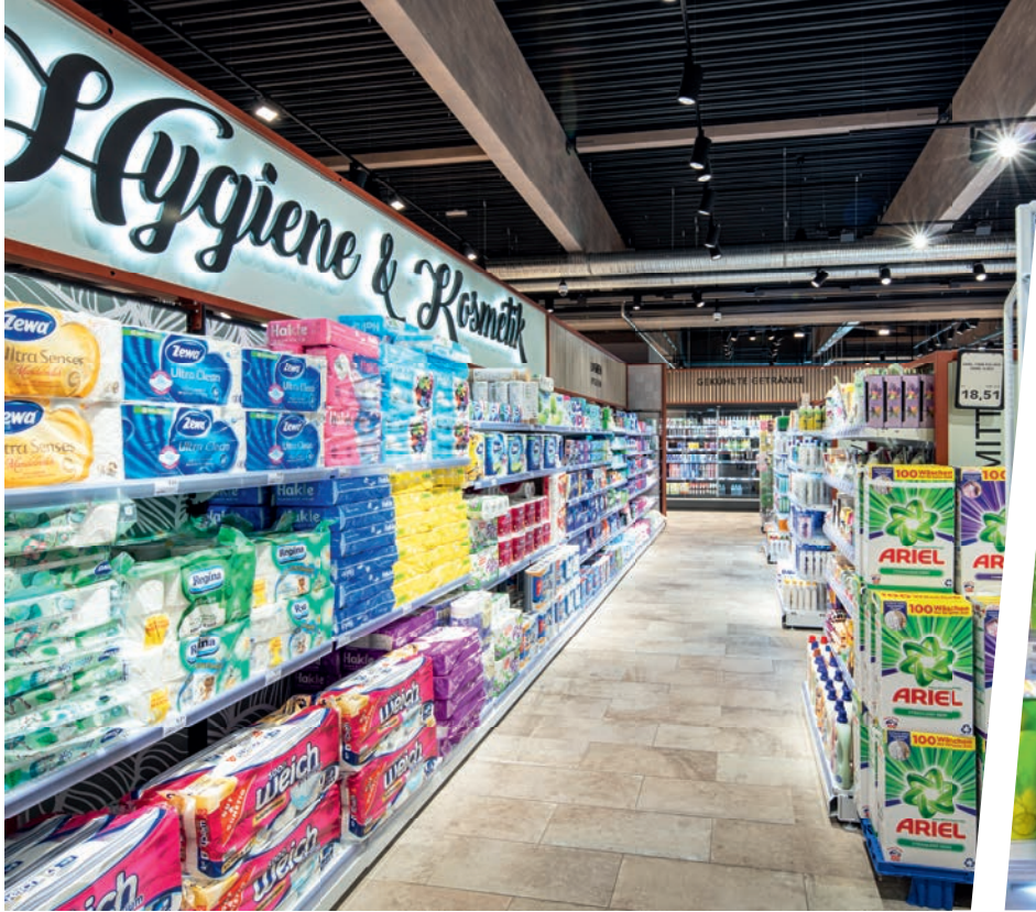
↑ WANZL-REGALSYSTEME schaffen auch für umfangreiche Produktpaletten ausreichend Platz.

↓ PREISAUZEICHNUNG – einfach gemacht: Hier stimmt das System bis ins Detail.