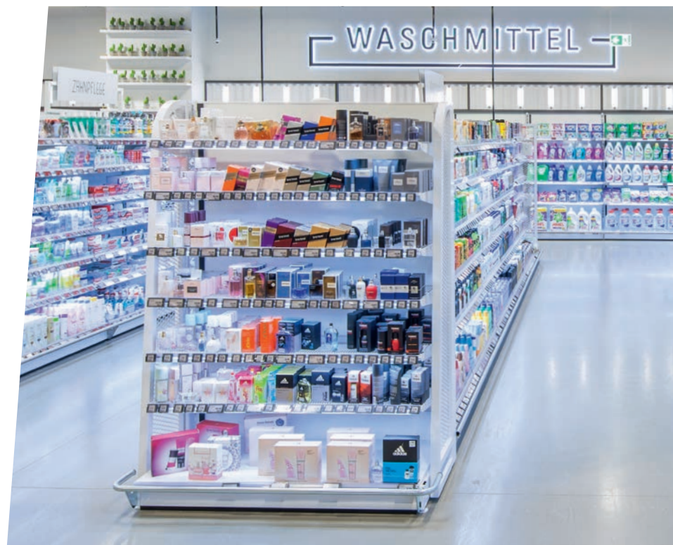
↑ VOM GONDELKOPF bis zur vollständigen Regaleinheit: Wanzl Shopping Solutions setzen Maßstäbe in der Produktpräsentation.