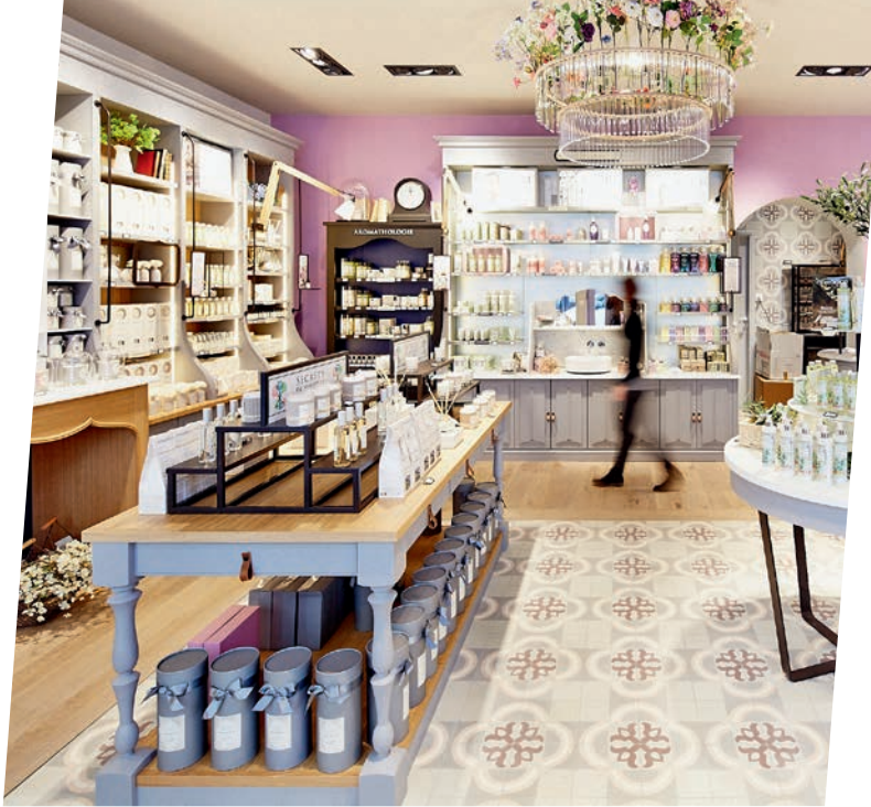
↔ « DURANCE » À PARIS : Un salon dédié à la beauté ? Un rêve devenu réalité !