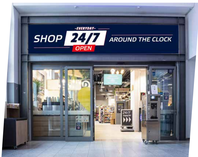
↑ DIE LUST AUF ETWAS BESONDERES kennt auch an Bahnhöfen keine Uhrzeiten. Also besser: »Shop around the Clock«!