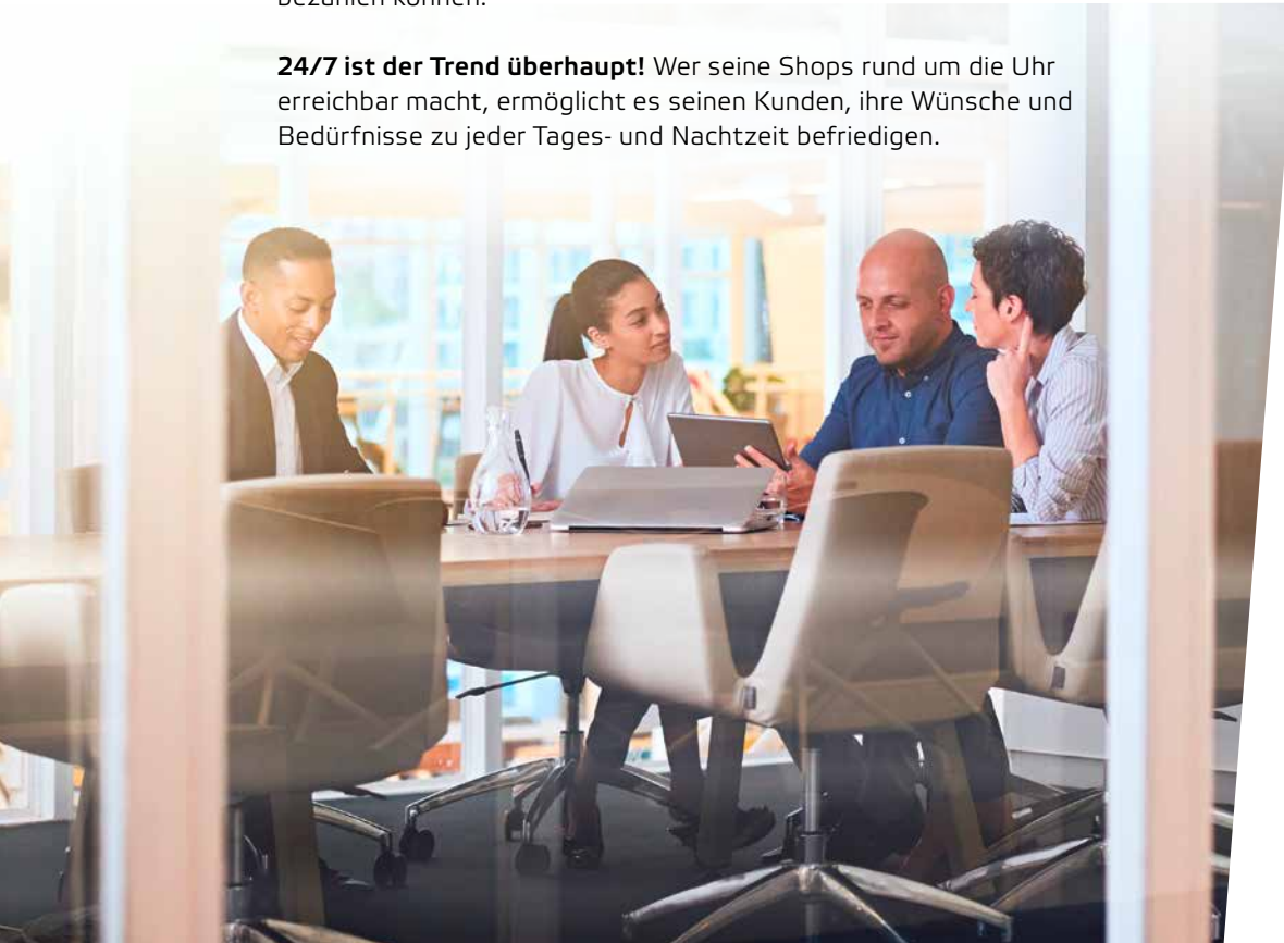
↑ BINNEN SEKUNDEN BESTELLT: Die Zwischenmahlzeit im Büroalltag

24/7 ist der Trend überhaupt! Wer seine Shops rund um die Uhr erreichbar macht, ermöglicht es seinen Kunden, ihre Wünsche und Bedürfnisse zu jeder Tages- und Nachtzeit befriedigen.