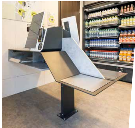
↑ BEQUEM ANGEORDNET: Scanner zum Erfassen der Ware.