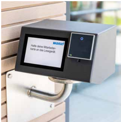
↑ EASY CHECK-IN: Schneller Zutritt für Ihre Kunden am POS.