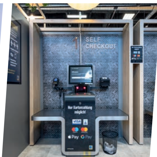
↑ ACQUISTI IN AUTONOMIA SENZA OSTACOLI: è possibile con il self-checkout all'uscita del negozio.