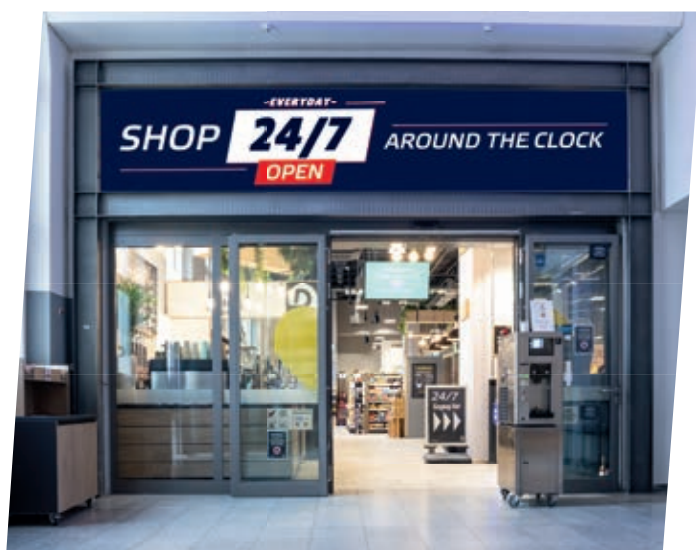
↑ LA VOGLIA DI QUALCOSA DI SPECIALE non ha orari nemmeno nelle stazioni ferroviarie. Quindi: "Shop around the Clock"!