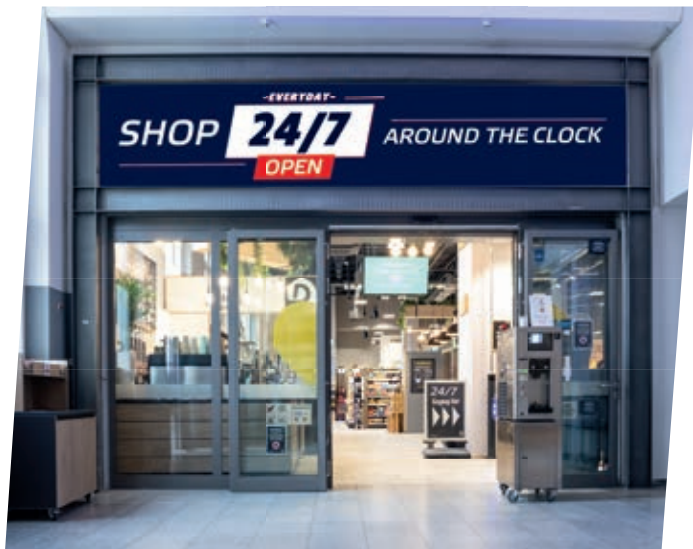
↑ LAS GANAS DE TOMAR ALGO ESPECIAL tampoco conocen horarios en las estaciones de tren. Así que mejor: ¡comprar a cualquier hora!