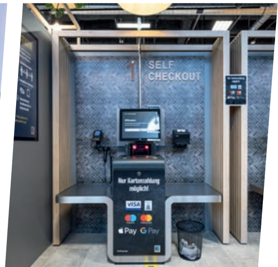
↑ COMPRA AUTÓNOMA SIN OBSTÁCULOS: el pago automático a la salida de la tienda lo hace posible.