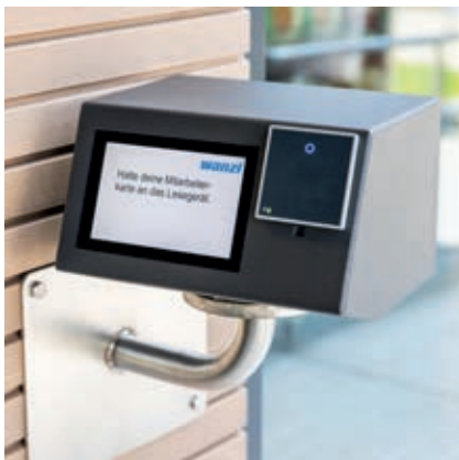
↑ ENTRADA FÁCIL: acceso rápido para sus clientes en el punto de venta.