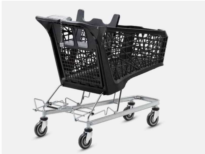
→ SUPPORT-CAISSE Pour transporter facilement des packs de bouteilles ou d'autres articles encombrants.