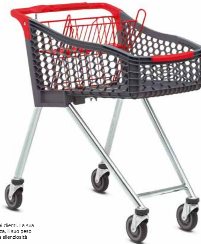
TANGO 90 è il preferito dai clienti. La sua maneggevolezza, il suo peso ridotto e la sua silenziosità entusiasmano.

■ Il compatto e maneggevole carrello Tango 90 è sempre disponibile quando serve: per le piccole spese o quando si ha fretta. Con la sua comoda dotazione non ha nulla da invidiare ai fratelli maggiori.