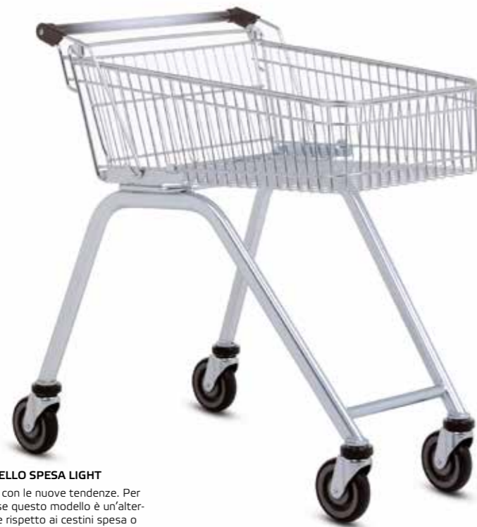
CON IL CARRELLO SPESA LIGHT siete al passo con le nuove tendenze. Per le piccole spese questo modello è un'alternativa migliore rispetto ai cestini spesa o alle borse portate da casa.

■ Il carrello spesa Light è il carrello ridotto in versione a filo metallico. Comodo da manovrare, costituisce il completamento ideale del parco carrelli standard. Il cestino merce piatto da 70 litri è pratico da caricare e per questo è il preferito di molti clienti.