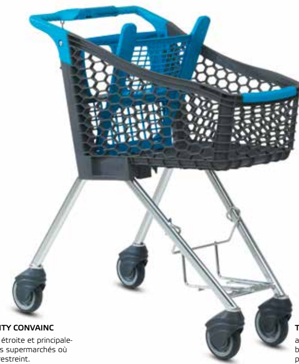
LE TANGO CITY CONVAINC par sa forme étroite et principalement dans les supermarchés où l'espace est restreint.

■ Tango City est un chariot innovant et tendance destiné aux petites et moyennes surfaces de vente. C'est aussi un chariot d'appoint idéal. Grâce à son maniement aisé, il est parfait pour faire des achats rapides. Il est également très apprécié pour le confort de son panier peu profond.