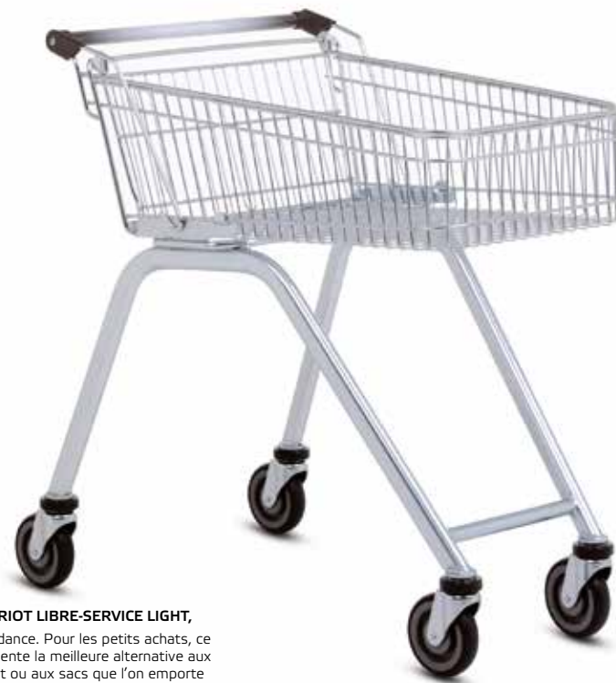
AVEC LE CHARIOT LIBRE-SERVICE LIGHT, vous êtes tendance. Pour les petits achats, ce modèle représente la meilleure alternative aux paniers d'achat ou aux sacs que l'on emporte avec soi dans le magasin.

■ Le chariot libre-service Light est la version fil du chariot d'appoint Wanzl. Agréable à conduire, il complète de manière idéale votre parc de chariots standard. Son panier de 70 litres, plat et peu profond, peut être chargé confortablement et constitue de ce fait le choix de prédilection pour de nombreux clients.