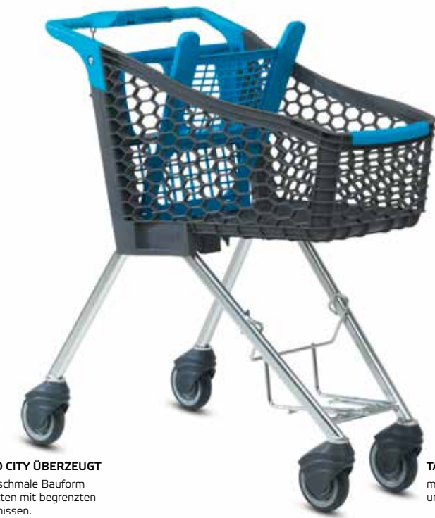
DER TANGO CITY ÜBERZEUGT durch seine schmale Bauform auch in Märkten mit begrenzten Platzverhältnissen.

■ Der innovative und trendige Einkaufswagen Tango City ist für kleine und mittelgroße Märkte und als Zweitwagen ideal geeignet. Er gefällt durch die einfache Handhabung beim schnellen Einkauf sowie durch den Komfort der geringen Korbtiefe.