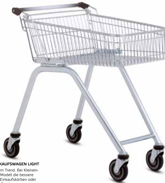
MIT DEM EINKAUFWAGEN LIGHT liegen Sie voll im Trend. Bei Kleinkäufen ist das Modell die bessere Alternative zu Einkaufskörben oder mitgebrachten Taschen.

■ Der Einkaufswagen Light ist der Zweitwagen in Drahtausführung. Bequem im Handling ergänzt er Ihren Standard-Fuhrpark ideal. Der flache 70-Liter-Warenkorb lässt sich komfortabel beladen und ist deshalb für viele Kunden erste Wahl.