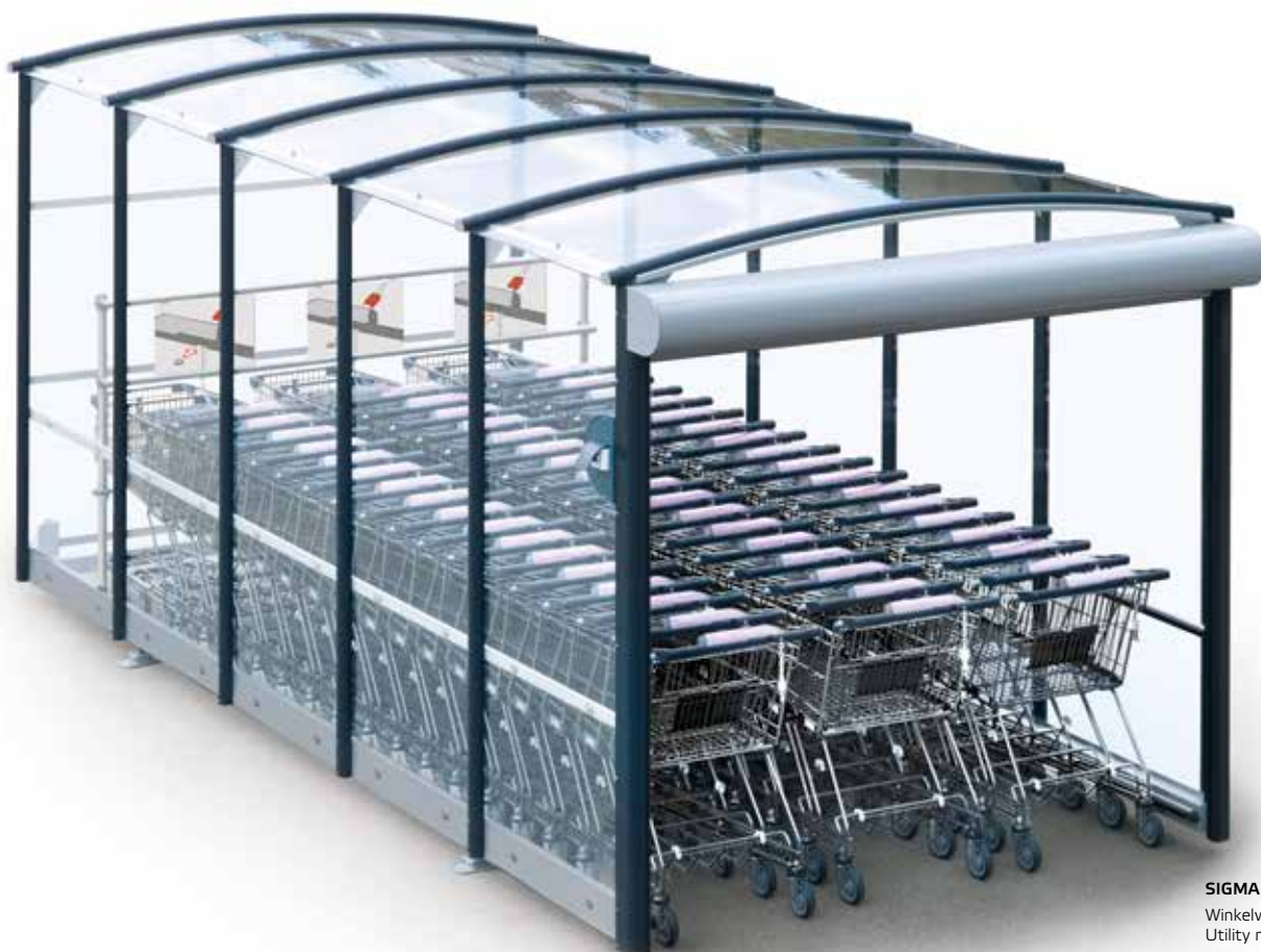
SIGMA Winkelwagenstalling Utility model pend.