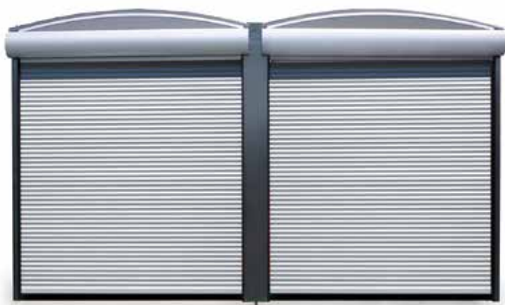
SIGMA PRESENT Buitenverkoopbox gesloten

■ Afgelopen met het steeds opnieuw uitstellen en opruimen van artikelen – u doet het rolluik van de Sigma Present 's morgens elektrisch of mechanisch open en 's avonds gewoon weer dicht. Dat bespaart tijd en mankracht. De verkoopbox zelf biedt veel ruimte voor het onderbrengen van artikelen op pallets.