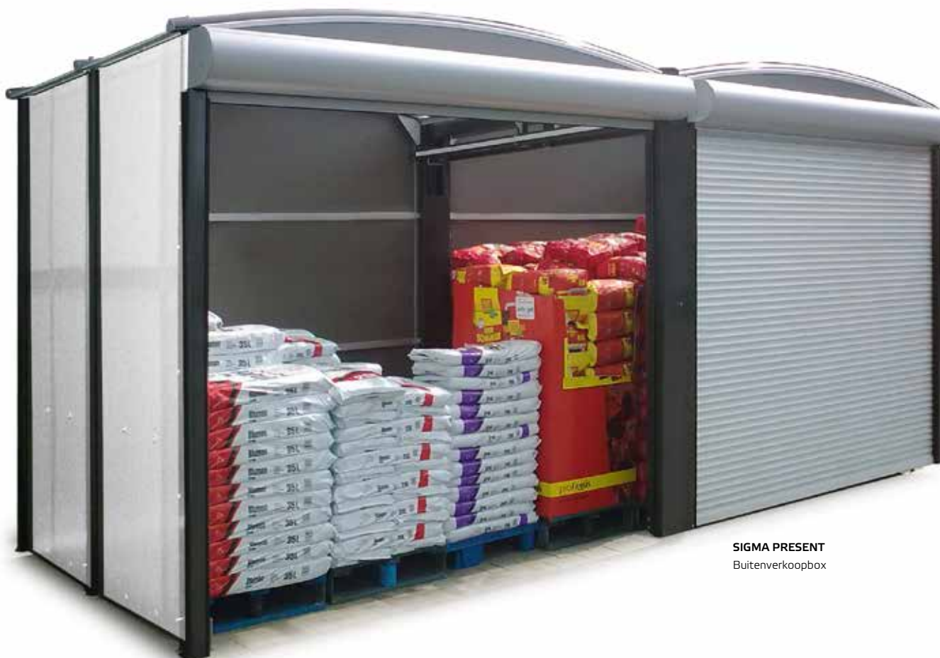
SIGMA PRESENT Buitenverkoopbox