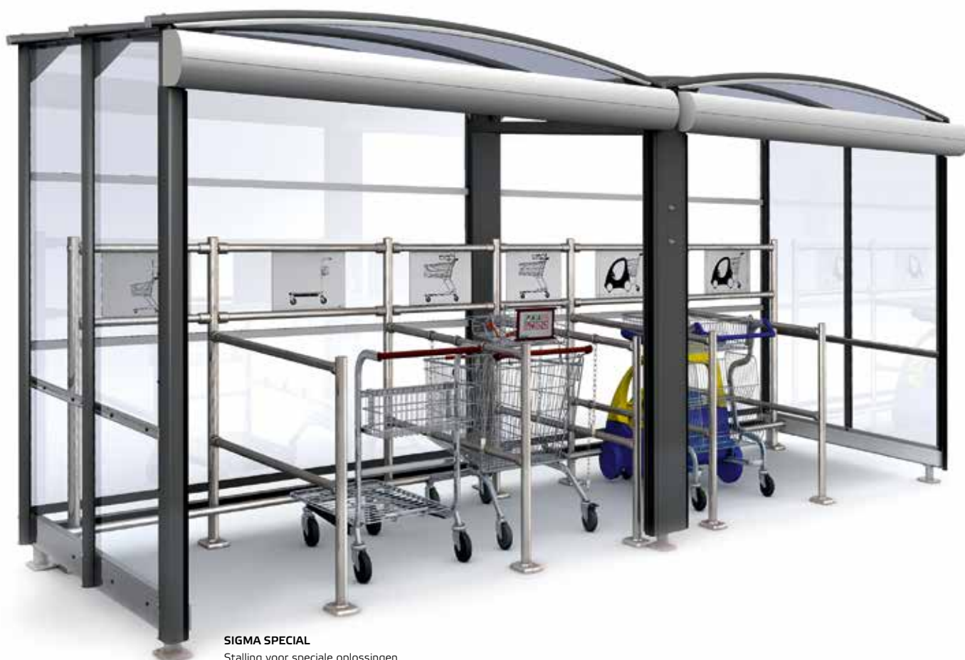
SIGMA SPECIAL Stalling voor speciale oplossingen Utility model pend.